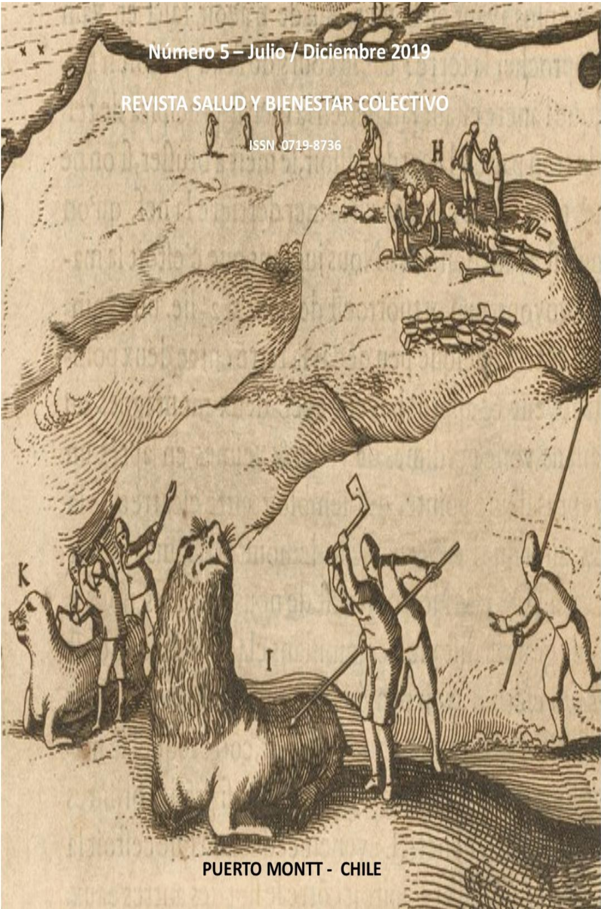
PUERTO MONTT - CHILE